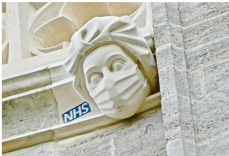
Sculpture représentant le visage d'une soignante ajouté sur une église du XI e siècle, dans le Dorset (Royaume-Uni), le 6 avril 2021.

L'annonce de l'Evangile étreint constamment une Croix concrète. Et le Pape de se souvenir d'avoir demandé à une Sœur très âgée, aux yeux clairs , de prier pour lui, parce qu'il avait besoin d'une grâce. Elle a fait silence comme si elle priait, l'a regardé et lui a dit « Certainement le Seigneur vous donnera la grâce, mais ne vous y trompez pas ; il la donnera à sa manière divine » ... Sentir que le Seigneur nous donne toujours ce que nous demandons, mais à la manière divine , c'est-à-dire avec la Croix. Non par cruauté, mais par amour, jusqu'à la fin